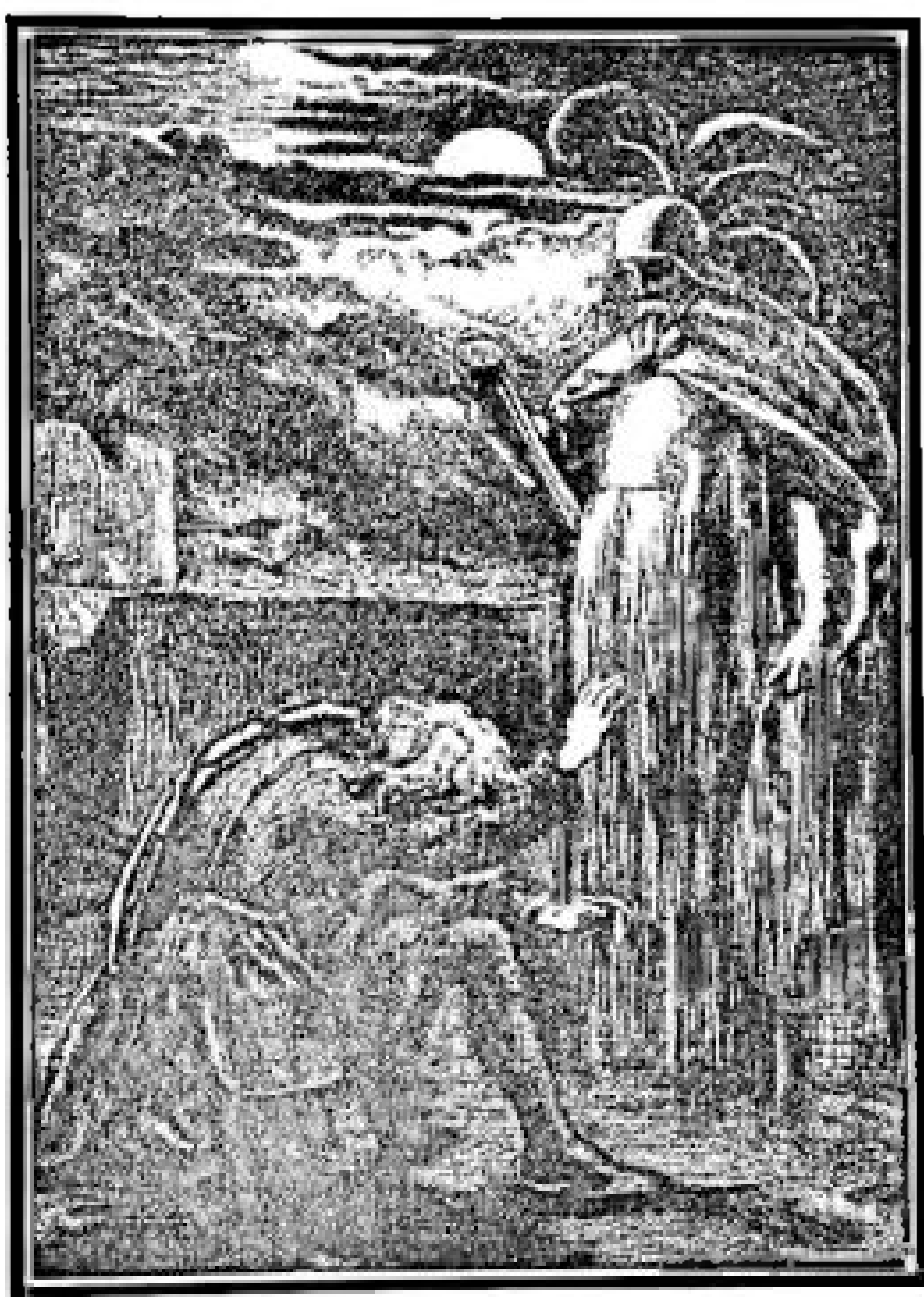
HAMLET- Prince of Danmarke